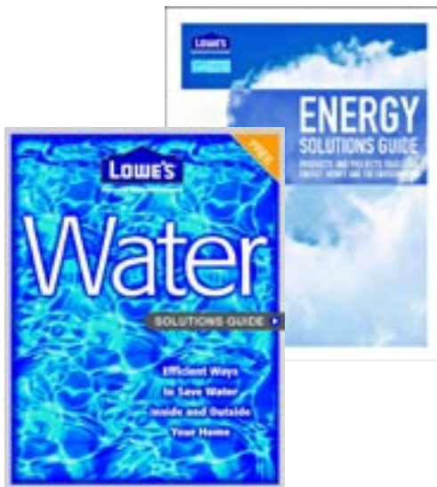
Energy & Water Solutions Guides, obténgalas gratis en las tiendas Lowe's