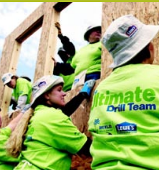
Mujeres voluntarias de Women Build ayudan a construir una pared en Detroit, MI