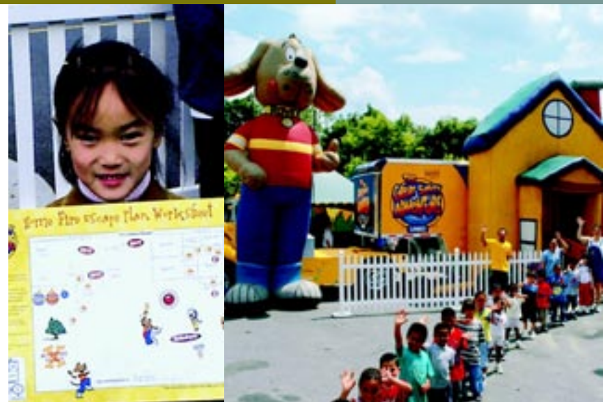
La Great Safety Adventure del Home Safety Council llevó consejos de seguridad a los hogares donde viven niños, que se transmitieron en más de 360 lugares, incluidas las tiendas Lowe's, las escuelas y en eventos especiales, Mooresville, NC

Lowe's Charitable And Educational Foundation Desde 1957, la fundación LCEF se ha dedicado a mejorar las comunidades a las que les ofrecemos nuestros servicios mediante el apoyo de la educación estatal y proyectos para mejorar la comunidad y el medio ambiente. En 2005, LCEF otorgó más de $13 millones en premios a organizaciones sin fines de lucro. Programa Toolbox For Education El programa