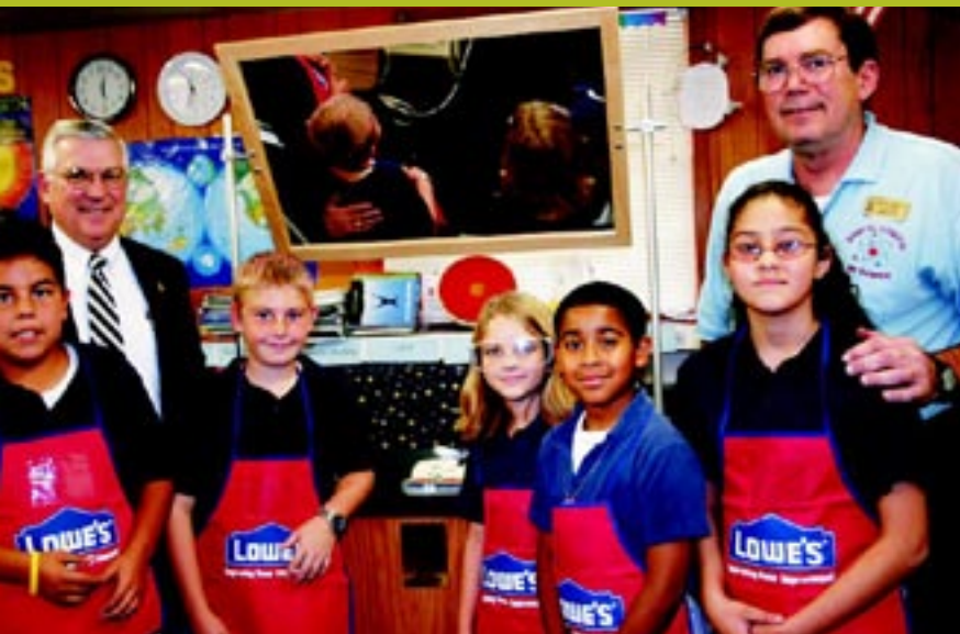
Una subvención de Lowe's de $55 000 ayudó a que los alumnos de ciencias tuvieran laboratorios móviles donde poder estudiar. San Antonio, TX