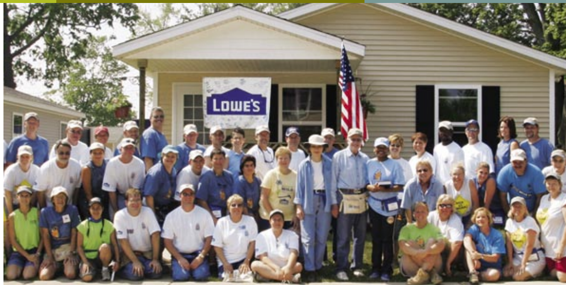
Proyecto de trabajo de Jimmy Carter, Benton Harbor, MI

Habitat For Humanity Lowe's pertenece a la red de socios nacionales de Habitat for Humanity International, que ayuda a brindar hogares seguros y a precios asequibles a miles de familias trabajadoras. Lowe's, nuestros clientes y nuestros socios proveedores aportaron más de $8 millones a proyectos de Habitat en 2005, y los empleados voluntarios de Lowe's colaboraron con su apoyo en hogares de costa a costa para ayudar a los propietarios de Habitat a con-