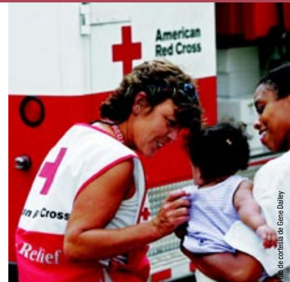
Esfuerzos de auxilio de la Cruz Roja después del huracán, Slidell, LA