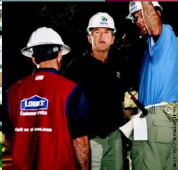
Presidente George W. Bush junto a los voluntarios de Lowe's, Operation Home Delivery, Covington, LA