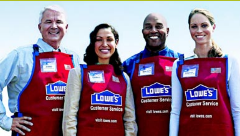
El programa de capacitación para la administración de las tiendas Lowe's prepara a los empleados para ocupar puestos gerenciales.