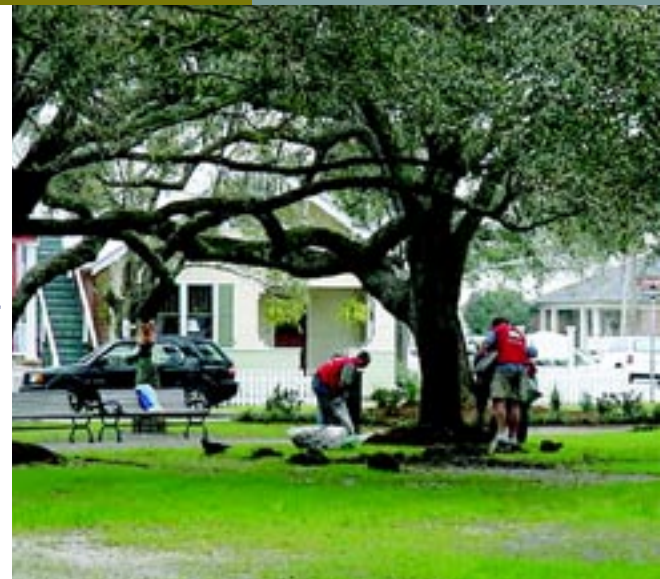
Empleados hacen trabajo voluntario mediante la iniciativa de Habitat y Lowe 's Hero , Pensacola, FL y Atlanta, GA

Empleos y beneficios Lowe's agregó 150 tiendas y aproximadamente 23 000 empleos en 2005; esto ayudó a estimular las economías locales con puestos de trabajo y deducciones impositivas. Los empleados tienen sueldos competitivos, amplios beneficios (como beneficios opcionales de cobertura médica para empleados de jornada completa y jornada media), el programa 401(k) de aportes compensatorios, un programa de compraventa de acciones descontadas y un descuento en