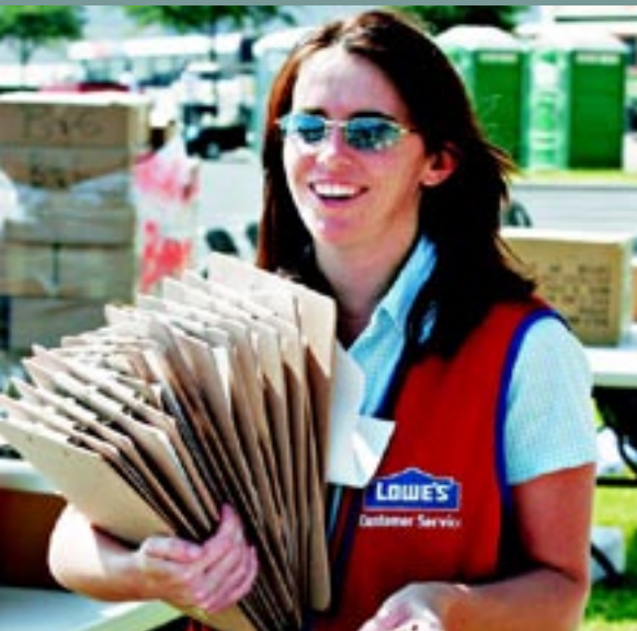
Voluntaria de Lowe's que ofrece esfuerzos de auxilio en el Astrodome, Houston, TX